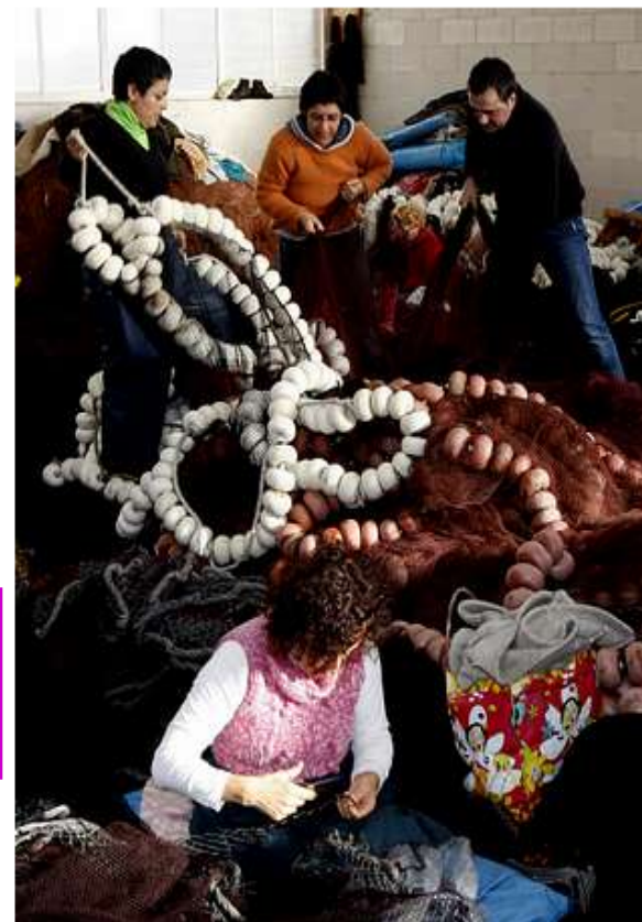
Las rederas de Cangas están mayoritariamente especializadas en los aparejos del cerco

Hay dos tipos de rederas: las que hacen los aparejos del cerco y las de artes menores. Es en esta modalidad en la que abundan las ilegales y es también en la que cobran salarios de miseria, entre dos y tres euros la hora. Les