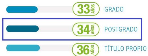
Edad media del alumno