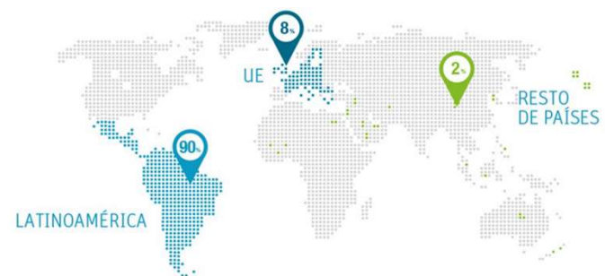
Curso académico 2015-2016