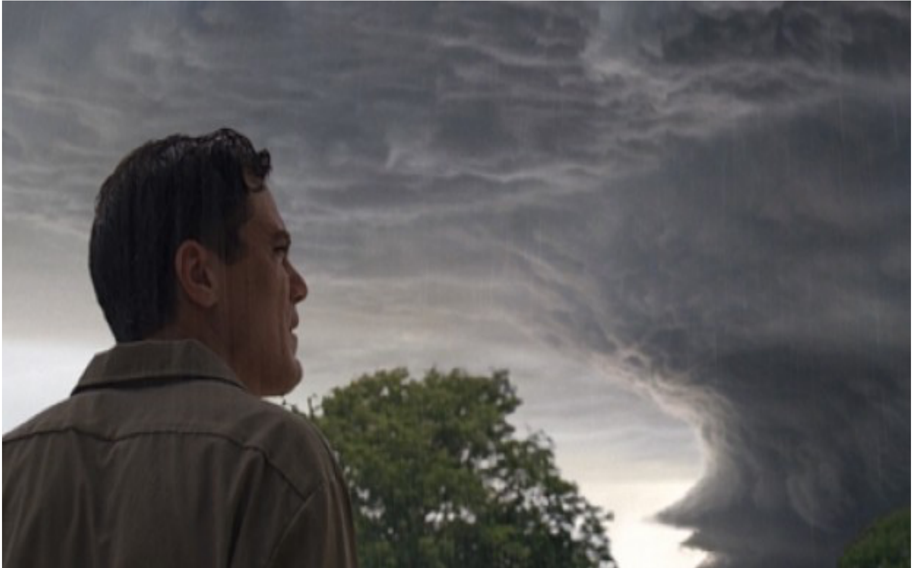
Imagen de la película TAKE SHELTER (Nichols, J., 2011)